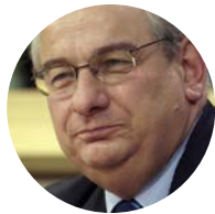
Michel Delebarre , Ancien Ministre d'Etat, Sénateur du Nord

Michel Delebarre, né le 27 avril 1946 à Bailleul (Nord), est un haut fonctionnaire (Préfet hors cadre) et homme politique français. Membre du Parti socialiste, il est sept fois ministre sous la présidence de François Mitterrand. Diplômé d'études supérieures en géographie, Michel Delebarre a été successivement Directeur de cabinet au Conseil régional du Nord-Pas de Calais (1974-1978), Délégué Général au développement (1977-1980) et Secrétaire général de la Ville de Lille (1980-1981) puis chargé de mission et Directeur de Cabinet à Matignon auprès du Premier ministre Pierre Mauroy (1982-1984). En 1984, il est nommé pour la première fois ministre ; il sera Ministre du Travail, de l'Emploi et de la Formation, Ministre des Affaires sociales et de l'Emploi, Ministre des Transports et de la Mer, Ministre de l'Équipement, du Logement, des Transports et de la Mer, Ministre d'État de la Ville et de l'Aménagement du Territoire (il inaugure ainsi le premier ministère de la ville), puis Ministre d'État de la Fonction Publique et des réformes administratives sous divers gouvernements socialistes entre 1984 et 1993. En 1989, il est élu maire de la Ville de Dunkerque. Il le restera jusqu'en 2014. Il a été également Président de la Communauté urbaine de Dunkerque de 1995 à 2014.