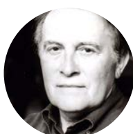
Henri Nallet, Président de la Fondation Jean-Jaurès Ancien Ministre