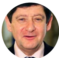
Patrick Kanner, Ministre de la ville, de la jeunesse et des sports, Ancien adjoint au Maire de Lille, Ancien Président du Conseil Général du Nord, Ancien Président de UNCCAS